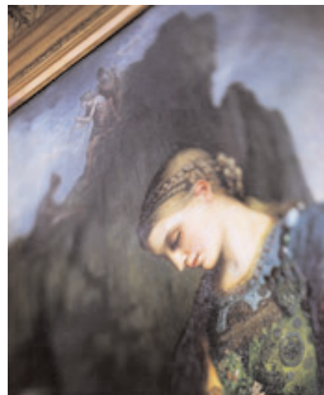
Réf 2 / Juan Manuel Castro Prieto, 2006. ©Juan Manuel Castro Prieto /VU' Gustave Moreau, Orphée (détail)