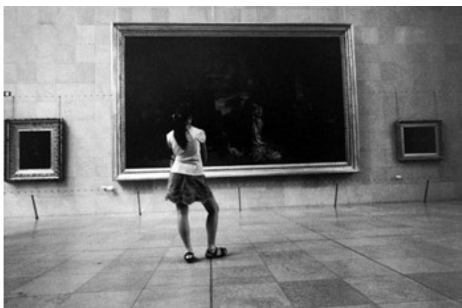
Américain. Né en 1949 à New York. Vit entre Paris et New York.

"Le jour où il a basculé du romantisme qui l'avait entraîné à Paris par passion pour Brassai et Doisneau - ce qui l'amena à photographier les cafés - vers le photojournalisme et la nécessité d'informer, cet Américain venu de l'univers des Beaux-Arts et marqué par la fréquentation de W. Eugène Smith ne fit pas les choses à moitié. Son engagement devint radical, sa photographie également, sans parler de sa prise de risque, pas toujours raisonnable. Mais c'est certainement pour cela que, devenu un héritier de la "concerned photography" , il écrit des pages essentielles de l'histoire du médium, au moment même où, en raison de l'irruption du numérique, nous allons vers d'autres temps. Il a passé dix ans à chroniquer la situation en Tchétchénie, à témoigner, y compris quand il ne se passait «rien» en termes d'actualité médiatique. Il avait compris - sans être compris à l'époque -, dès l'effondrement du bloc soviétique, que les républiques du Caucase seraient le lieu d'une des crises majeures du monde contemporain et a décidé d'en témoigner. Au delà des publications dans la presse et des expositions dans le monde entier, le livre dans lequel il a su dépasser le témoignage sur la Tchétchénie pour questionner l'absurdité de la guerre à la fin du XX e siècle est un repère, une date. Il était au Rwanda. Il est évidemment normal qu'il soit parti pour l'Afghanistan, l'Irak et La Nouvelle-Orléans".