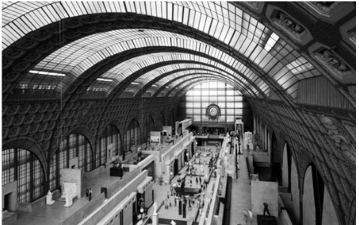
La nef centrale

"Giona et la baleine de pierre. Enfant, ma grand-mère m'emmenait souvent à l'église et puisqu'on habitait le centre de Milan de temps en temps on entrait dans le dôme, la cathédrale gothique de la ville. Je me souviens de la perception d'un espace infini, d'une solennité mystique, où les nefs s'enfuient vers le haut, dans un espace imprégné d'une brume très fine. J'éprouvais la sensation enivrante de se perdre dans l'infini, de se sentir tout petit dans l'illimité. Peut-être que la gare d'Orsay, elle aussi, a été conçue, comme beaucoup d'œuvres architecturales publiques du XIX e siècle, pour susciter le respect et impressionner la population. Je m'imagine le flux des passagers sur les quais, les voix des porteurs, les adieux des parents, le sifflement des chefs de train. Aujourd'hui le musée d'Orsay conserve ce rapport dimensionnel. La présence des œuvres exposées, l'envahissement de sculptures visibles d'un même point de vue font "oublier" la grandeur spatiale du projet original. En se rendant au sommet du bâtiment, depuis ses "miradors", on découvre des points de vue spectaculaires. Le plus surprenant c'est de découvrir, à l'intérieur de la structure de la voûte, un parcours secret, un passage entrelacé dans un ensemble de matériaux : un "voyage étonnant" dans le corps d'une énorme baleine, une plongée imprévisible entre deux surfaces. Un lieu inaccessible, une zone pour les "désaxés" qui réunit le présent et le passé".