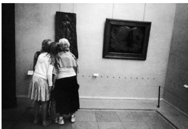
Réf 5 / Stanley Greene, 2006. © Stanley Greene / VU' Série consacrée au public du musée d'Orsay. Dans la salle des Colonnes.