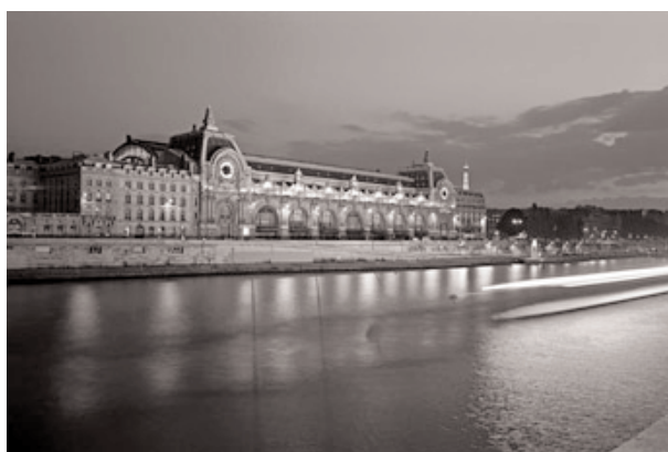
Réf 3 / Gabriele Basilico, 2006. © Gabriele Basilico / VU' La façade nord du musée d'Orsay vue du quai François Mitterrand.