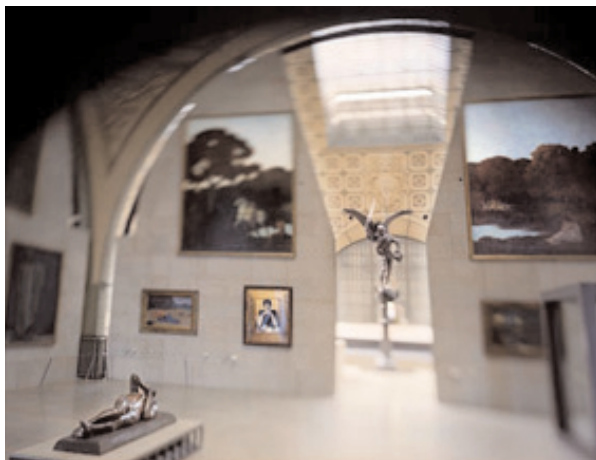
Salle du musée d'Orsay, niveau médian. Œuvres exposées de gauche à droite : Alexandre Séon, Lamentation d'Orphée ; Louis Welden Hawkins, Séverine ; Émile René Ménard, L'Age d'or (2 parties) ; Emmanuel Fremiet, Saint Michel terrassant le dragon.