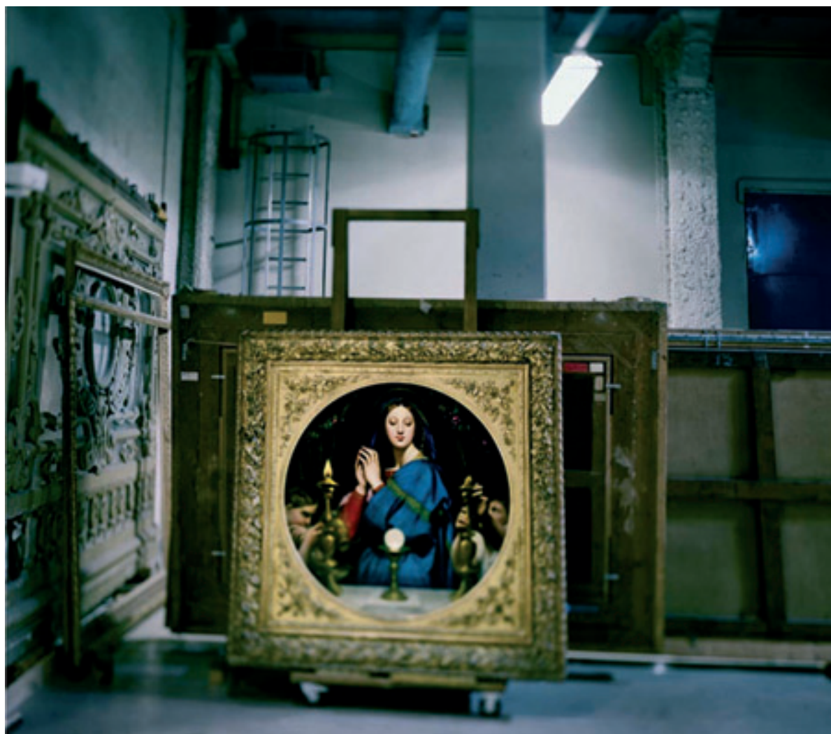
Jean Auguste Dominique Ingres, la Vierge à l'hostie, 1854 - huile sur toile

Espagnol. Né en 1958 à Madrid. Vit à Madrid.