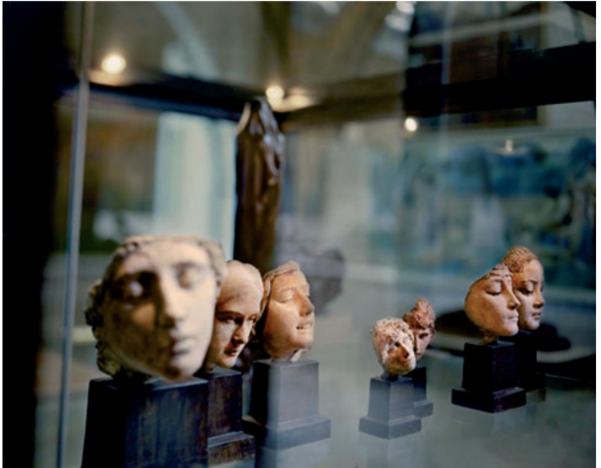
Charles René de Saint-Marceaux, masques, Douleur, Langueur

"En arrivant au musée, j'ai regardé les peintures et les sculptures avec des yeux de maraudeur. Tout y était si beau! Je voulais les posséder, les ramener chez moi... Non, c'était bien trop dangereux! Alors par la photographie j'ai élaboré un plan; je les transformerai en photographies. Pour éviter les soupçons, j'en modifierai l'aspect extérieur avec mes outils, je les rendrai plus floues. Je les recadrerai, j'en altérerai les couleurs, sans que personne ne se doute que par ces photographies j'en aurai saisi les âmes. Un jour, elles seront à moi. Rien qu'à moi, au Voleur d'Âmes".